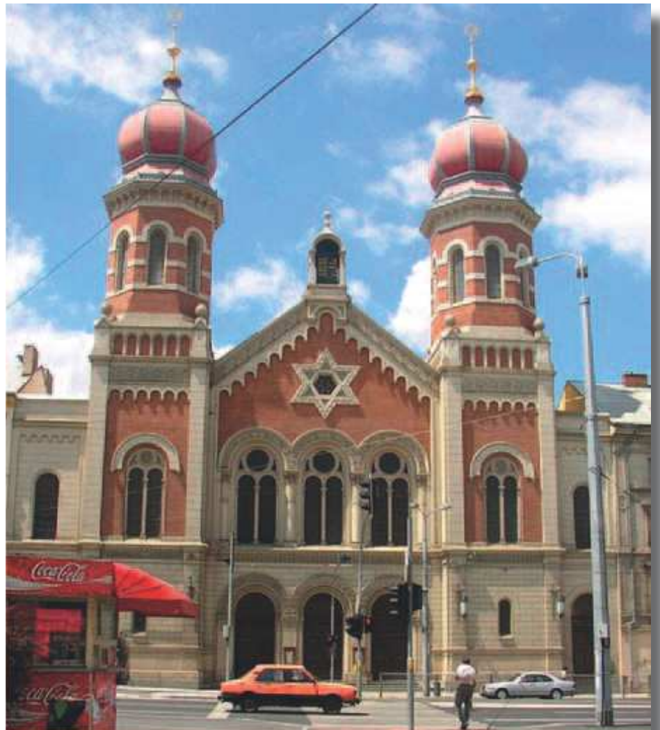
Plzeň'n kaupungissa Tšekin tasavallassa sijaitsee maailman 3. suurin synagoga.

la hyväksyy hänet ko. käskyjen noudattamisen kautta. Perustana tälle otetaan profeetta Miikan kirjasta kohta, jossa sanotaan: ”Sillä kaikki kansat vaeltavat jumalansa nimessä kukin, mutta me vaellamme Herran, meidän Jumalamme nimessä aina ja iankaikkisesti” (4:5).